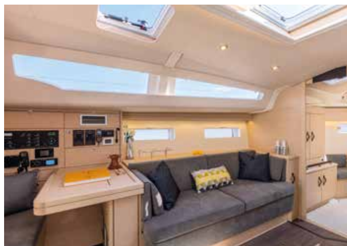
Large sofa and forward-facing nav station / Grand sofa et table à carte dans le sens de la marche