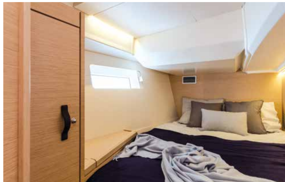
Aft area can be configured as a storage room, guest cabin (shown) or skipper accomodation / Zone arrière configurable en workshop, cabine invitées ou cabine skipper