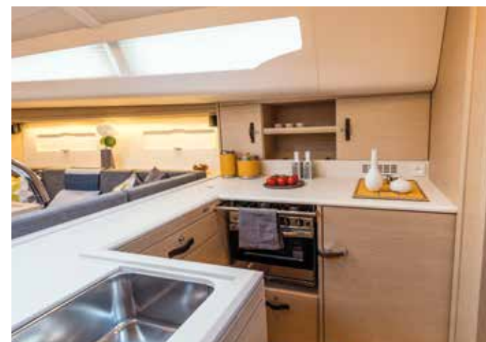
U Galley with lots of storage / Cuisine en U avec beaucoup de rangement