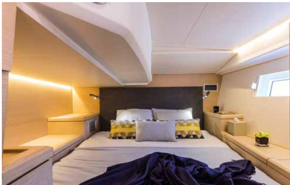
VIP cabin: a truly unique feature / Cabine VIP: une caractéristique unique