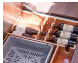
Underfloor wine locker / Cave à vin sous plancher